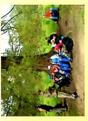
"Хорошо сидим или привал на обочине!" (Низовский Константин, 953 гр.)