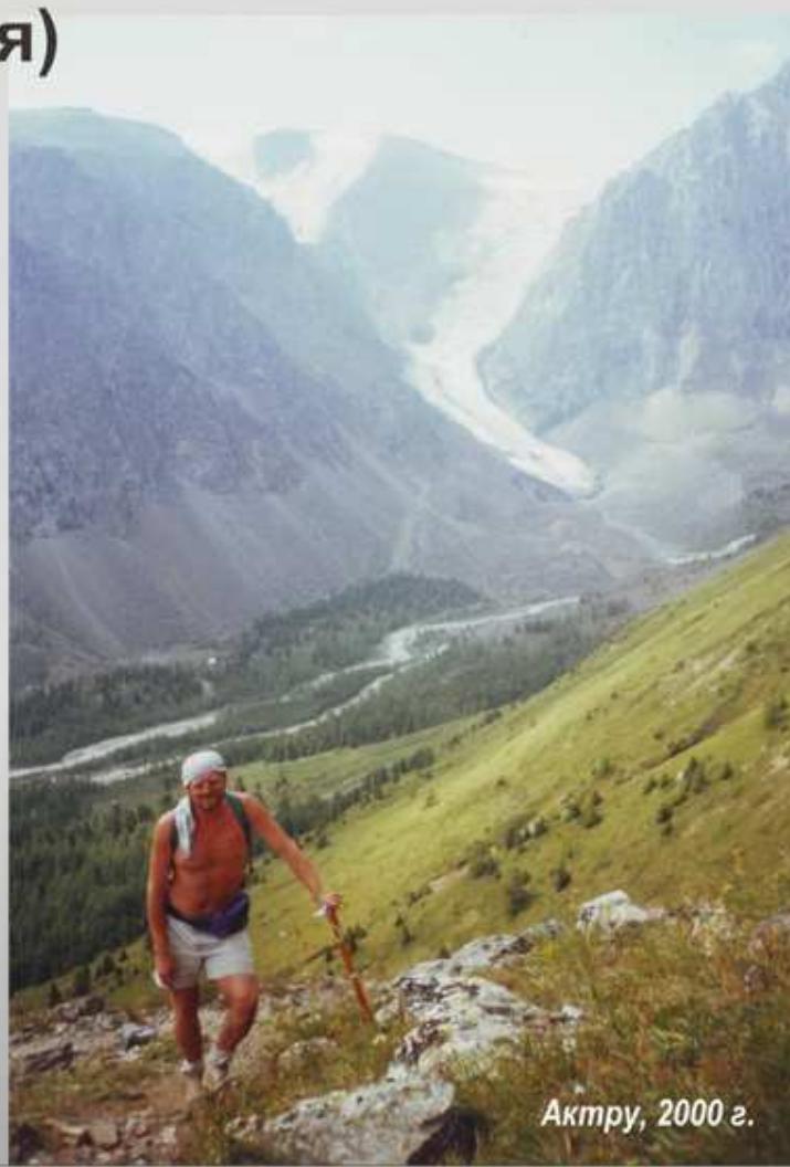
Актру, 2000 г.

Через два дня после трудоустройства меня направили на экспедиционные работы. Мне повезло работать на БАМе, в Приморье, Якутии, а потом я перешел в партию, занимающуюся топографическими съемками шельфа п-ова Камчатка. В Камчатку я просто влюбился, и даже возникли мысли перебраться с семьей жить на этот замечательный полуостров. К этому времени семья наша увеличилась - родился сын. Но жизнь богаче планов и получилось так, что мы должны были уехать с Дальнего Востока в регион с более сухим климатом. Самым подходящим вариантом казался Алтай, тем более на Алтае я проходил учебную и производственную практики и он мне очень нравился. И тут началась мистика.