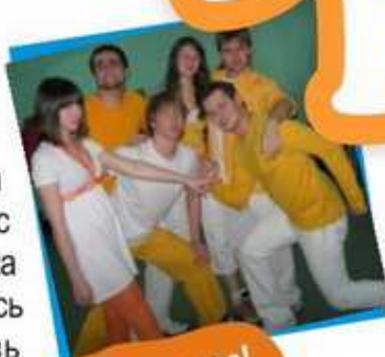
Мы - команда!