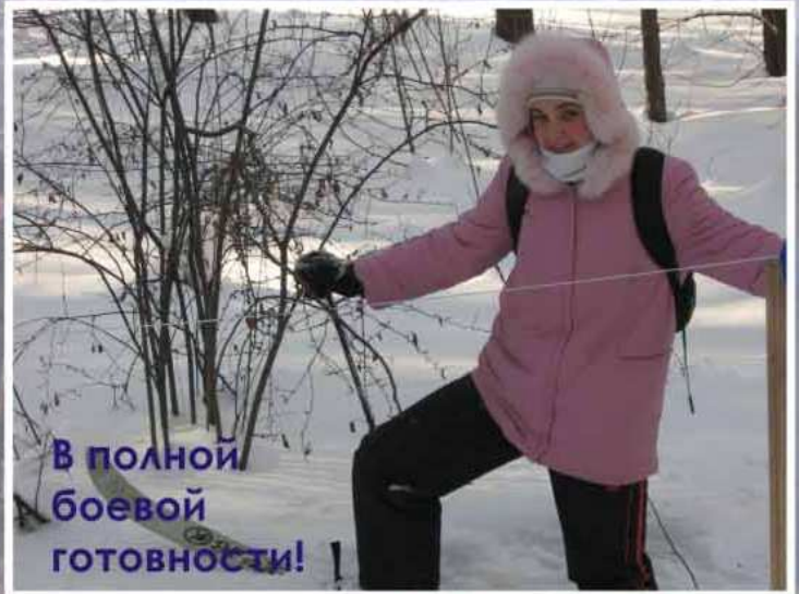
В полной боевой готовности!