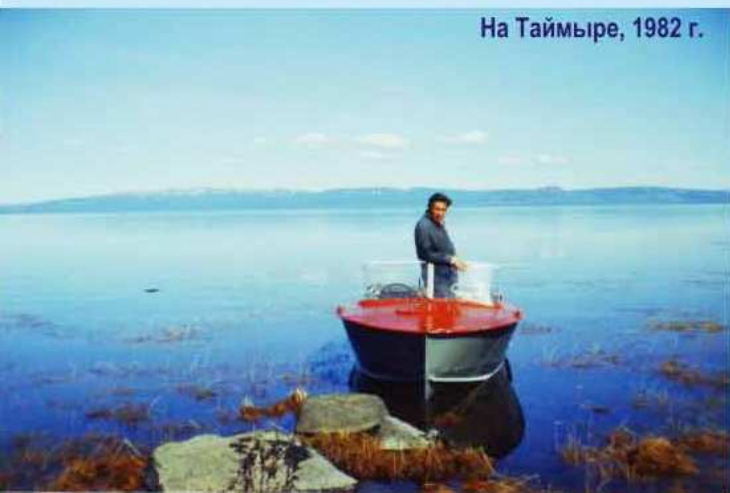
На Таймыре, 1982 г.

Студент бежит быстрее трамвая, Бразды пушистые взрывая, А на штанах его давно В Европу прорвано окно.