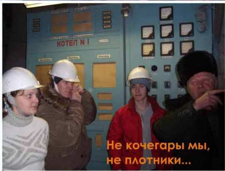
Не кочегары мы, не плотники...