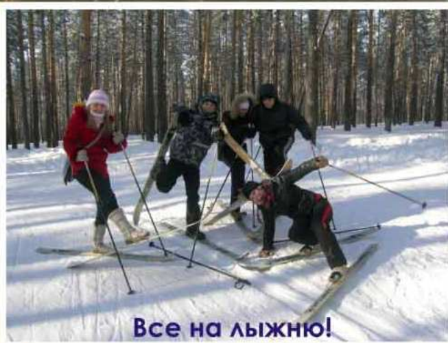
Все на лыжню!