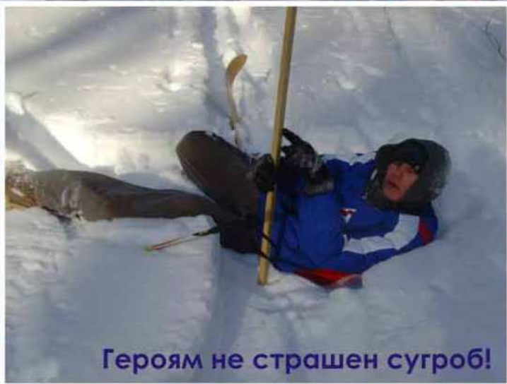
Героям не страшен сугроб!