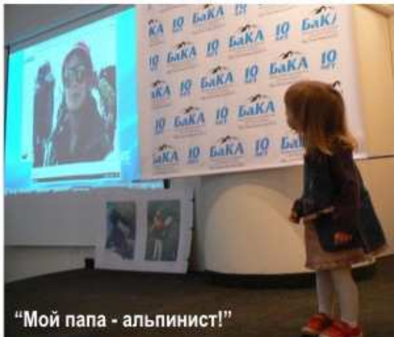
"Мой папа - альпинист!"