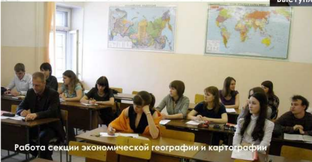
Работа секции экономической географии и картографии