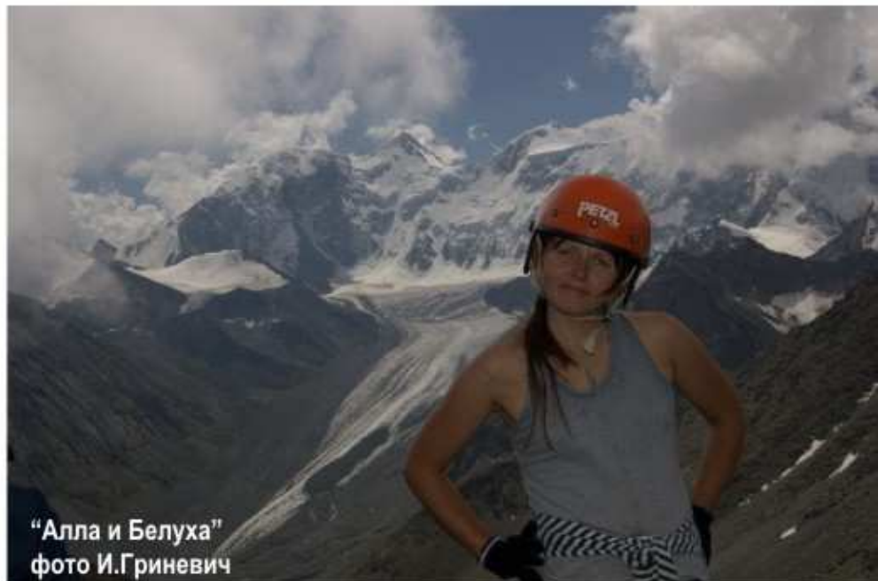
"Алла и Белуха"

С 1 мая по 1 сентября выставка работает в библиотеке им. В.Я. Шишкова. Вход свободный. "ГОРЫ И ЛЮДИ" ждут Вас!