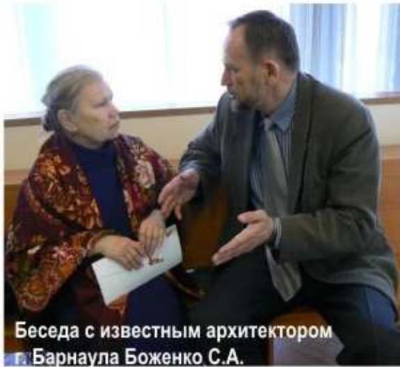
Беседа с известным архитектором г. Барнаула Боженко С.А.