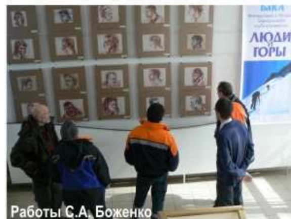
Работы С.А. Боженко